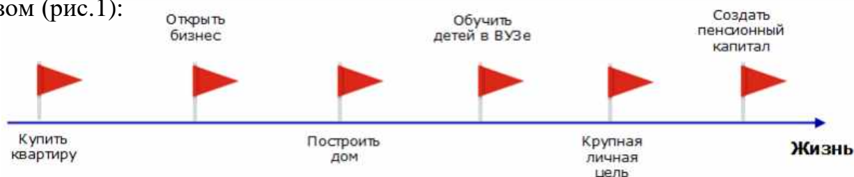
Рисунок 1 – Пример крупных финансовых задач семьи

По мере взросления человек понимает, что перед ним в жизни стоят важные финансовые задачи. Например, они могут выглядеть следующим образом (рис.1):