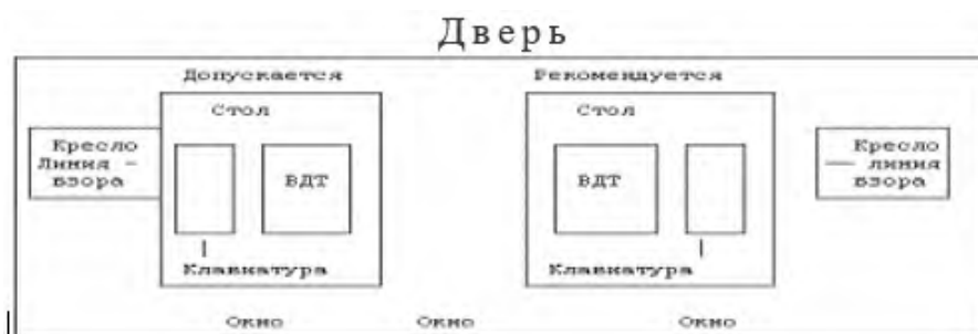
Рисунок 2 – Схема расположения рабочих мест относительно светопроемов