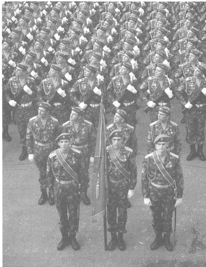
Сухопутные войска Российской Федерации

специальных войск, а также части и учреждения тыла.