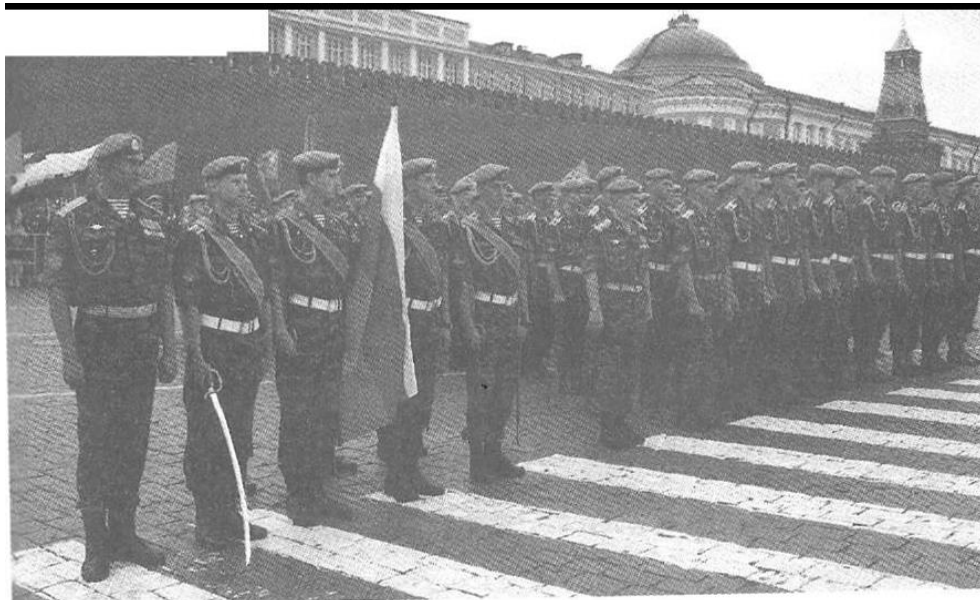
Рис. 31. Воздушно-десантные войска Российской Федерации

и подразделений, а также из частей и подразделений специальных войск и тыла.