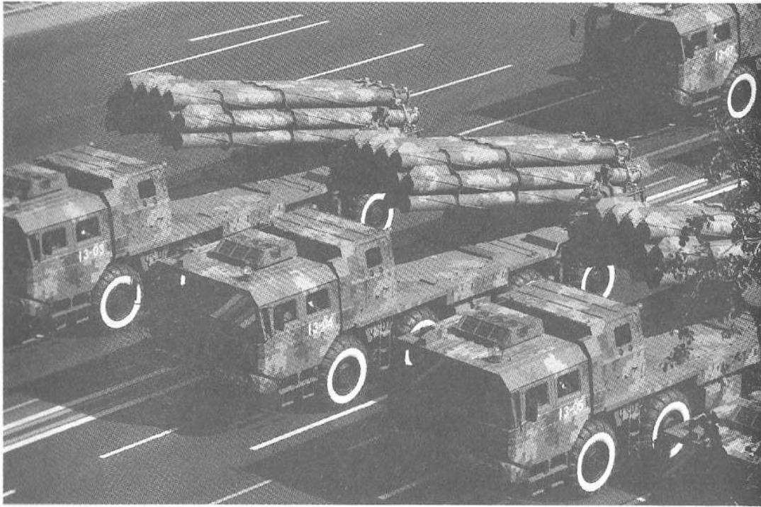
Рис. 29. Ракетные войска Российской Федерации

в кратчайшие сроки; возможность широкого маневра ракетно- ядерными ударами; независимость боевого применения от условий погоды, времени года и суток.