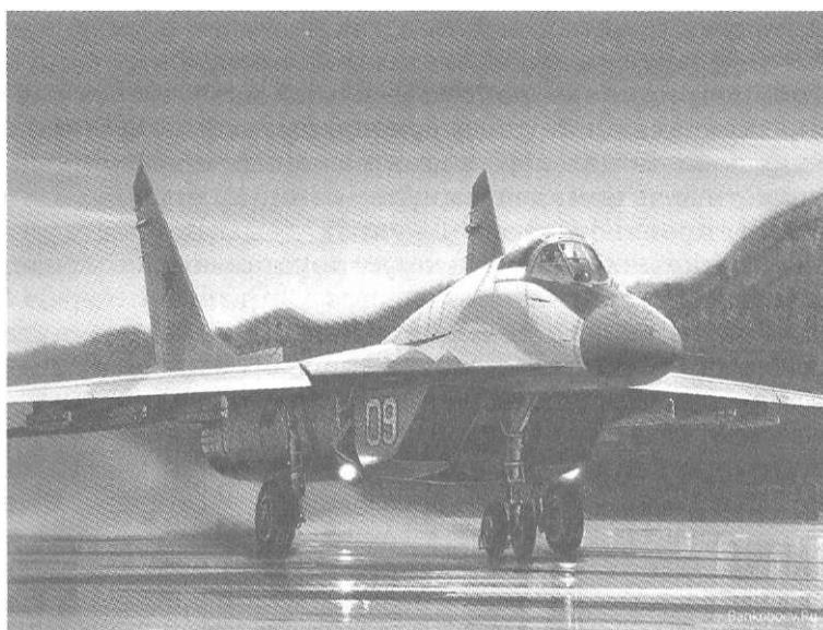
Военно-воздушные силы Российской Федерации

Эти задачи войска ВВС могут выполнять в любых погодных условиях, в любое время суток и года.