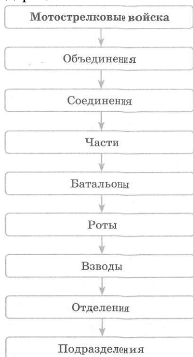
Схема 1. Структура мотострелковых войск Вооруженных сил Российской Федерации

История создания видов Вооруженных сил связана со способами ведения вооруженной борьбы и тем пространством, на котором она ведется: на суше, на море и в воздухе.