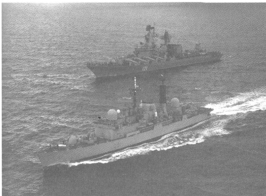
Военно-морской флот Российской Федерации

высадку морских десантов противника, перевозить войска, материальные средства и выполнять другие задачи.