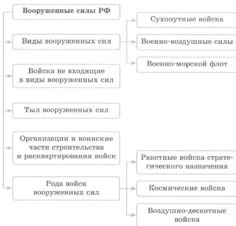
Схема 1. Структура вооруженных сил Российской Федерации

Вид Вооруженных сил — это часть Вооруженных сил государства, предназначенная для ведения военных действий в определенной сфере (на суше, море, в воздушном и космическом пространстве).