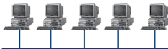
Рисунок 3 – Топология сети Шина

Шина (bus) , при которой все компьютеры параллельно подключаются к одной линии связи, и информация от каждого компьютера одновременно передается ко всем остальным компьютерам (см. рисунок 3). Согласно этой топологии создается одноранговая сеть. При таком соединении компьютеры могут передавать информацию только по очереди, так как линия связи единственная.