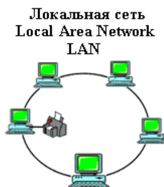
Рисунок 1 – Организация локальной сети

Локальные сети (LAN, Local Area Network) объединяют абонентов, расположенных в пределах небольшой территории, обычно не более 2–2.5 км (см. рисунок 1).