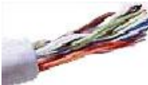
Рисунок 6 – Неэкранированная витая пара

При конструировании сетей используют следующие виды кабелей: