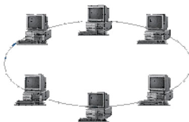
Рисунок 5 – Топология сети Кольцо

Кольцо (ring) , при котором каждый компьютер передает информацию всегда только одному компьютеру, следующему в цепочке, а получает информацию только от предыдущего в цепочке компьютера, и эта цепочка замкнута (см. рисунок 5). Особенностью кольца является то, что каждый компьютер восстанавливает приходящий к нему сигнал, поэтому затухание сигнала во всем кольце не имеет никакого значения, важно только затухание между соседними компьютерами.