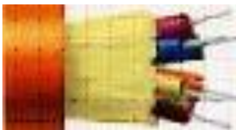
Рисунок 8 – Волоконно-оптический кабель

коаксиальный кабель (см. рисунок 7). Отличается более высокой механической прочностью, помехозащищённостью и позволяет передавать информацию на расстояние до 2000 м со скоростью 2-44 Мбит/с;