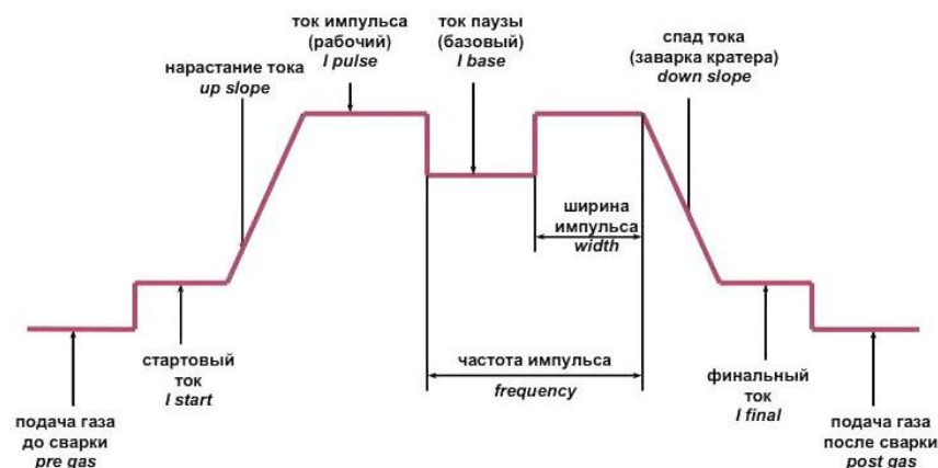
Рисунок 2 - Изменение сварочного тока при импульсной сварке на постоянном токе

Безразмерная величина G = t_{п}/t_{и} является одним из технологических параметров, характеризующих проплавляющую способность периодически горящей дуги при заданных энергии импульса и длительности цикла. Эта величина называется жесткостью режима .