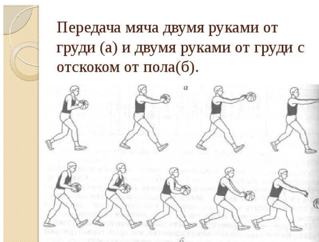
Передача мяча двумя руками от груди (а) и двумя руками от груди с отскоком от пола(б).

Передача двумя руками от груди используется чаще всего, чем какая-либо другая передача. При этой передаче мяч толкается вперед от верхней части груди ударным движением рук и тела.