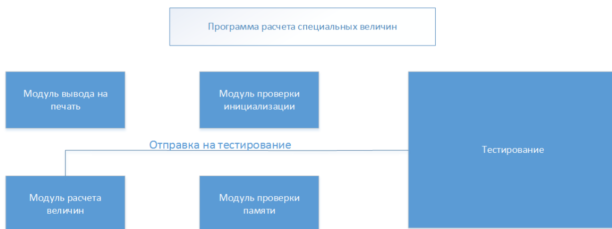
Рисунок 2 – Расчет времени для проведения подтестов

На примере разработки расчетной задачи (рисунок 2) существует необходимость сориентировать экспертов на тестирование модуля, отвечающего за основной функционал ПО – модуля расчета.