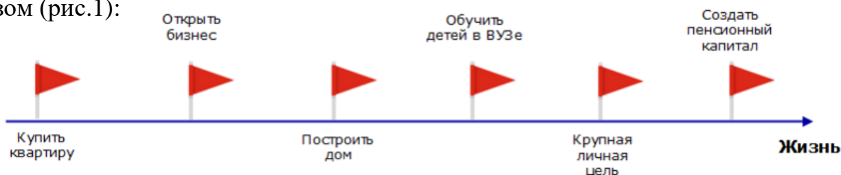
Рисунок 1 – Пример крупных финансовых задач семьи

По мере взросления человек понимает, что перед ним в жизни стоят важные финансовые задачи. Например, они могут выглядеть следующим образом (рис.1):