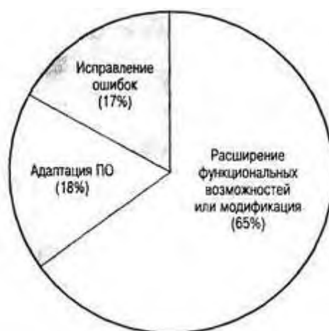
Рисунок 1. Распределение типов сопровождения

усовершенствование структуры и производительности с сохранением функциональных возможностей.