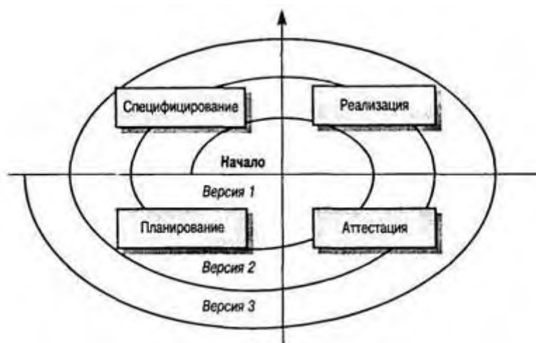
Рисунок 2. Спиральная модель развития ПО

Значительная часть бюджета большинства организаций уходит на сопровождение ПО, а не на само использование программных систем. В 1980-х годах было обнаружено, что во многих организациях по меньшей мере 50% всех средств, потраченных на программирование, идет на развитие уже существующих систем. При этом от 65 до 75% средств общего бюджета расходуется на сопровождение. Так как предприятия заменяют старые системы коммерческим ПО, например программами планирования ресурсов, эти цифры никак не будут уменьшаться. Поэтому можно утверждать, что изменение ПО все еще остается доминирующим в статье затрат организаций на программное обеспечение.