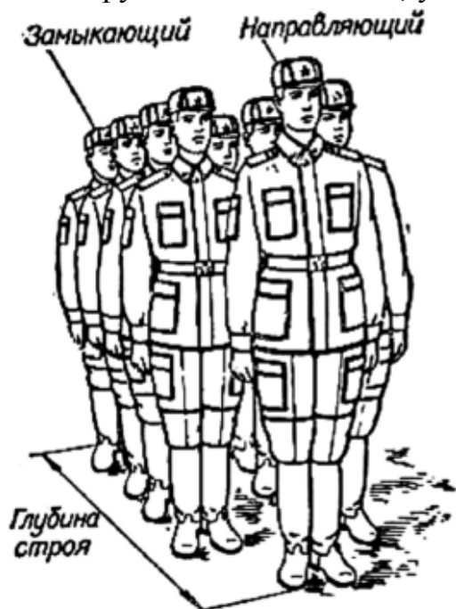
Рис. 3. Походный строй в колонну по два

Походный строй (рис. 3) - подразделение, взвод, отделение, группа, класс (далее - отделение ) построены в колонну или подразделения в колоннах построены одно за другим на дистанциях, установленных руководителем занятия.