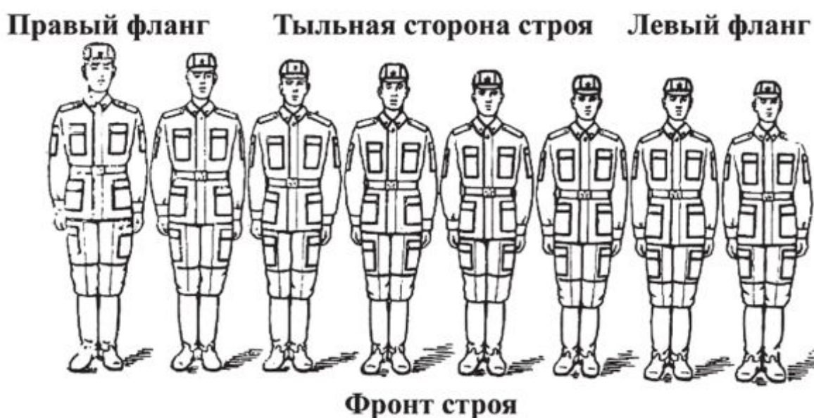
Рис. 1. Одношереножный строй (шеренга) и его элементы

Указав на строй, руководитель говорит: «Строй, в котором вы сейчас стоите, есть развернутый одно – шереножный строй, после чего объясняет, показывает и дает определения: флангу и фронту строя, тыльной стороне строя, интервалу и ширине строя.