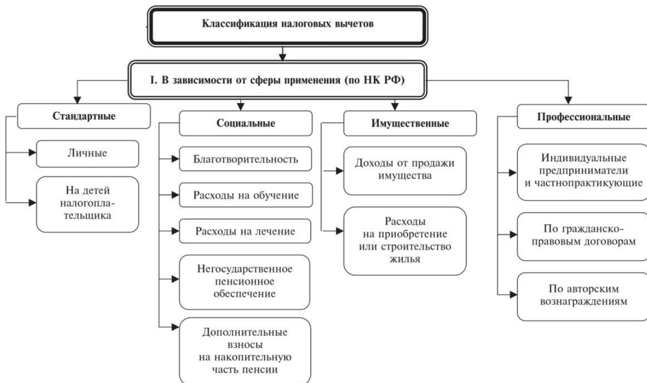
Рисунок 2 – Классификация налоговых вычетов