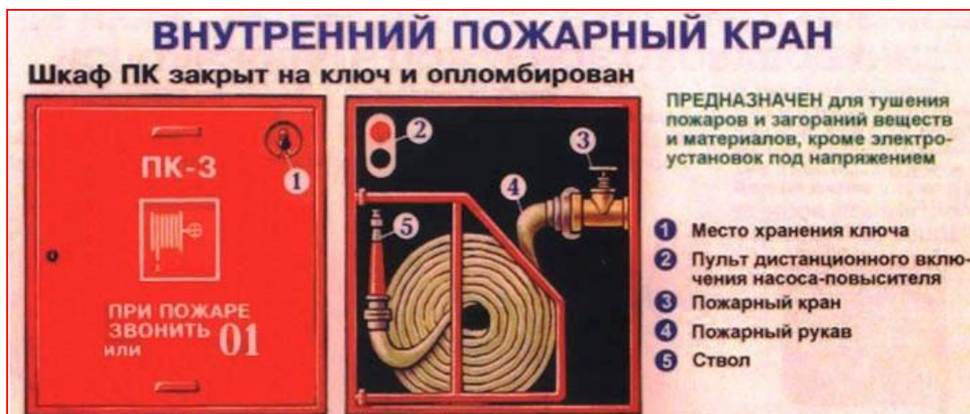
Рисунок 3.3 – Внутренний пожарный кран

Внутренний пожарный кран предназначен для тушения загораний веществ и материалов, кроме электроустановок под напряжением. Размещается в специальном шкафчике, оборудуется стволом и рукавом, соединенным с краном (см. рисунок 3.3).