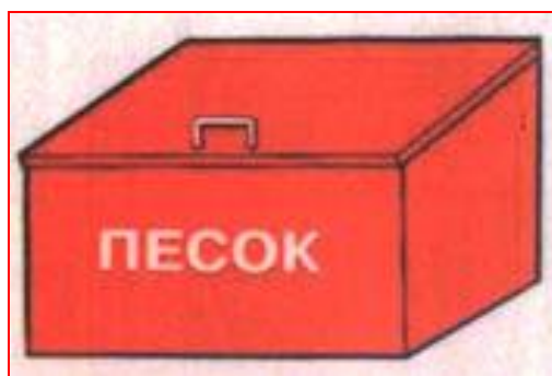
Рисунок 3.1 – Ящик для песка

Здания и помещения должны быть оборудованы первичными средствами пожаротушения. Для их размещения устанавливают специальные щиты (ГОСТ 12.4.009–83). На щитах размещают огнетушители, ломы, багры, топоры, ведра. Рядом со щитом устанавливается ящик с песком и лопатами, а также бочка с водой 200—250 л.