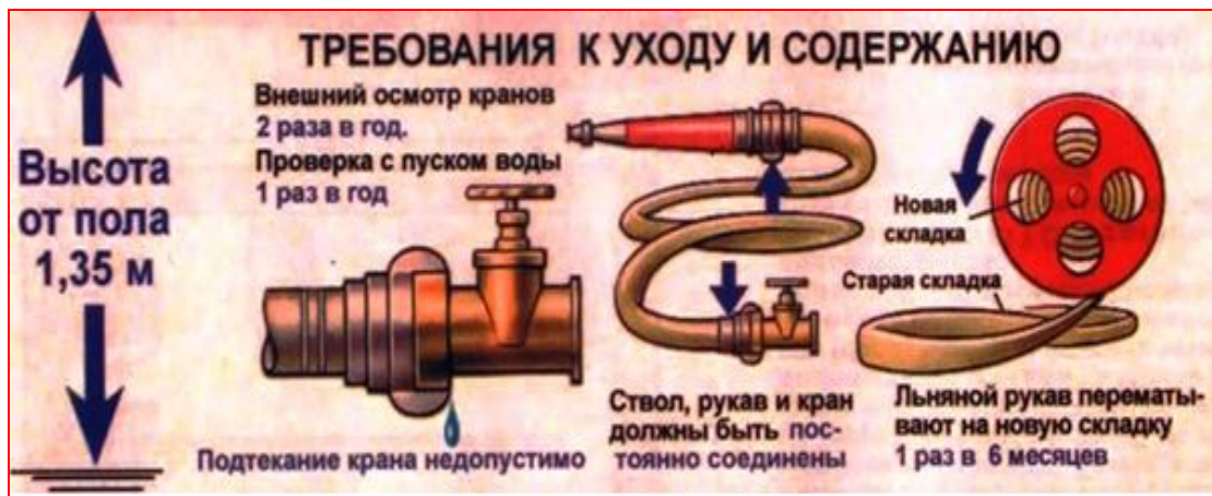
Рисунок 3.4 – Требования к уходу и содержанию внутреннего пожарного крана

Не пытайтесь тушить огонь, если он начинает распространяться на мебель и другие предметы, а также, если помещение начинает наполняться дымом. Тушить пожар самостоятельно целесообразно только на его ранней стадии, при обнаружении загорания, и в случае уверенности в собственных силах. Если с загоранием не удалось справиться в течение первых нескольких минут, то дальнейшая борьба не только бесполезна, но и смертельно опасна.