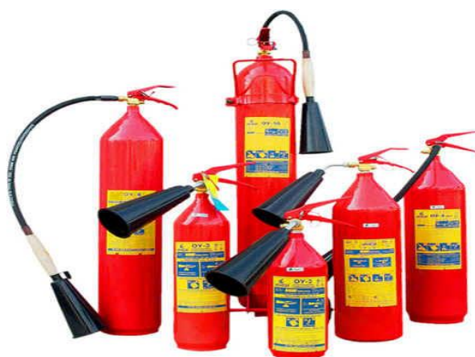
Рисунок 3.5 – Огнетушители углекислотные

Огнетушители углекислотные предназначены для того, чтобы потушить горение различных веществ, но только таких, горение которых не может происходить без доступа воздуха: возгораний на электрифицированном железнодорожном и городском транспорте, в автомобилях, на электроустановках, которые находятся под напряжением до 1000 В, в квартирах, на промышленных предприятиях. Огнетушители углекислотные не предназначены для тушения загорания веществ, горение которых может происходить без доступа воздуха (алюминий, магний и их сплавы, натрий, калий).