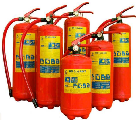
Рисунок 3.6 – Огнетушители порошковые

Принцип действия: рабочий газ закачан непосредственно в корпус огнетушителя, при срабатывании запорно – пускового устройства прокалывается заглушка баллона с рабочим газом (углекислый газ, азот). Газ по трубке подвода поступает в нижнюю часть корпуса огнетушителя и создаёт избыточное давление. Порошок вытесняется по сифонной трубке в шланг к стволу. Нажимая на курок ствола, можно подавать порошок порциями. Порошок, попадая на горящее вещество, изолирует его от кислорода и воздуха (см. рисунок 3.6).