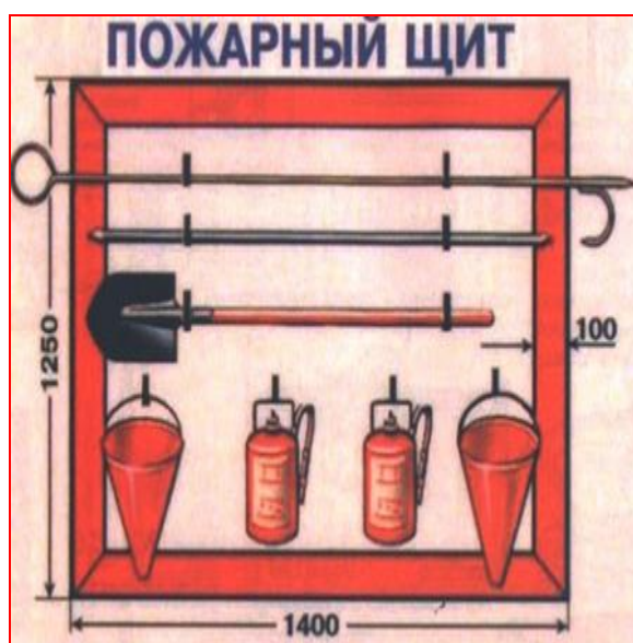
Рис.3.2. Пожарный щит

Здания и помещения должны быть оборудованы первичными средствами пожаротушения. Для их размещения устанавливают специальные щиты (ГОСТ 12.4.009–83). На щитах размещают огнетушители, ломы, багры, топоры, ведра. Рядом со щитом устанавливается ящик с песком и лопатами, а также бочка с водой 200—250 л.