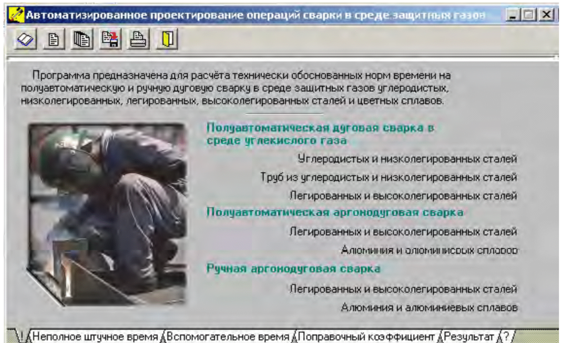
Рисунок 4.27 - Окно выбора способа сварки при проектировании операции дуговой сварки в защитных газах

легированных и высоколегированных сталей; -ручная аргонодуговая сварка неплавящимся электродом с присадкой алюминия и алюминиевых сплавов