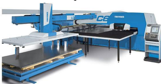
Рисунок 11–Просечные прессы для раскроя металла

Главное предназначение этого оборудования – это раскрой заготовок из металла. Прессы этого класса отличаются высокой точностью работы и широким диапазоном пробиваемых отверстий.