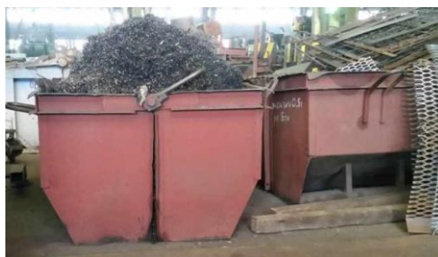
Рисунок 2–Технологические отходы в виде стружки