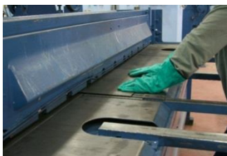
Рисунок 7—Рубка гильотиной

Следует отметить, что если ножи имеют подобающую заточку и установлены с минимальной погрешностью, то рез получается без заусенцев и замятий. При этом, на листе не будет возникать кривизна, так как рез происходит во всей длине листа одновременно.