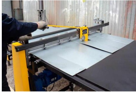
Рисунок 4—Станок для резки листового металла с дисковыми ножницами

В случае необходимости обработки большой партии заготовок имеет смысл использовать комбинированный метод. Он заключается в том, что заготовки, имеющие разную форму, укладывают в прямоугольник с минимизированными размерами. Затем эти прямоугольники используют для лучшего заполнения листа. Формирования размерной последовательности. Перемещая эти формы по поверхности, получают улучшенную форму конфигурации.