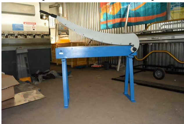
Рисунок 8–Гильотина для раскроя металла сабельного типа

Существует еще одна разновидность гильотин – сабельные. Их также используют в кустарных мастерских или небольших производствах.