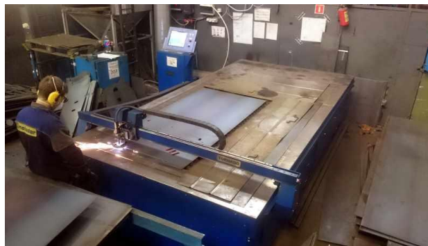
Рисунок 5—Метод лучшего заполнения короткой стороны листа

В случае необходимости обработки большой партии заготовок имеет смысл использовать комбинированный метод. Он заключается в том, что заготовки, имеющие разную форму, укладывают в прямоугольник с минимизированными размерами. Затем эти прямоугольники используют для лучшего заполнения листа. Формирования размерной последовательности. Перемещая эти формы по поверхности, получают улучшенную форму конфигурации.