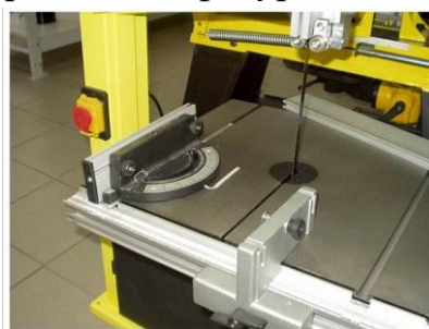
Рисунок 10—Фигурный раскрой металла на ленточной пиле

Станки этого класса представляют массу возможностей при обработке прутков, фасонных профилей, труб. На станках некоторых марок допустимо выполнять не только прямые резы, но и фигурные.