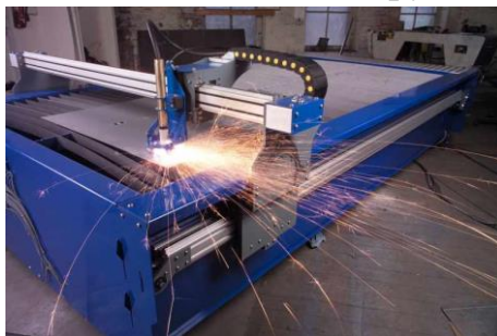
Рисунок 1–Процесс раскроя металла

Раскрой листового и другого профильного проката является одной из важнейших операций при создании металлоконструкций.