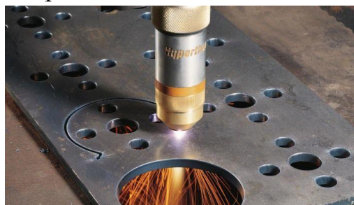
Рисунок 13–Плазменный метод раскроя металла

Плазма зарождается при нагреве газа до сверхвысоких температур, при этом происходит его ионизация. За счет перемещения молекул газа, она обладает определенной токопроводимостью.