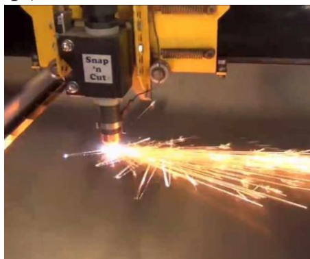
Рисунок 12–Газокислородная резка металла

Для обеспечения реза металла применяют смесь кислорода и горючего газа (пропана, ацетилен и пр.).