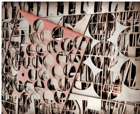
Рисунок 3–Отходы от раскроя металла

К первому типу отходов относят тот металл, которые теряют вследствие технологической обработки. Например, при использовании газовой резки – это оплавление, в виде стружки, снимаемой с поверхности заготовки по время течения или фрезерования. К отходам относят ту часть металла, которая уже не будет использована в дальнейшем.