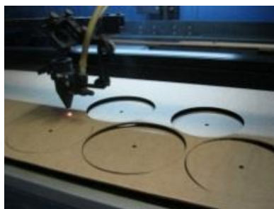
Рисунок 6—Из плотной бумаги или картона подготавливают шаблоны заготовок, которые необходимо раскроить. Шаблоны располагают на лист и путем передвижения и их совмещения между собой получают оптимальный раскрой листового материала.