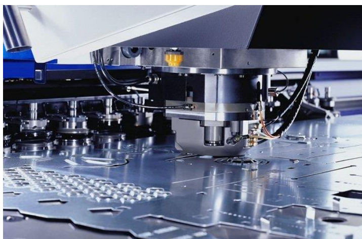
Процесс получения штампованных деталей

Рассматриваемый нами процесс получения штампованных деталей может быть объемным либо листовым.