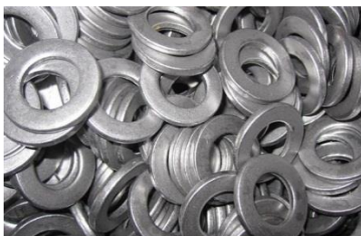
Производство различных метизов

Объемная холодная штамповка позволяет получать указанные детали без царапин и рисок, а также иных поверхностных дефектов.