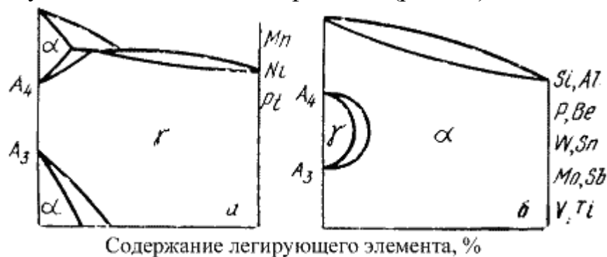
Рис. 1. Схематические диаграммы состояния Fe – легирующий элемент. а – для элементов, расширяющих область существования \gamma -модификации; б – для элементов, сужающих область существования \gamma -модификации

Большинство элементов или повышают A_4 и снижают A_3 , расширяя существовавшие \gamma -модификации (рис.1.а), или снижают A_4 и повышают A_3 , сужая область существования \gamma -модификации (рис.1.б).