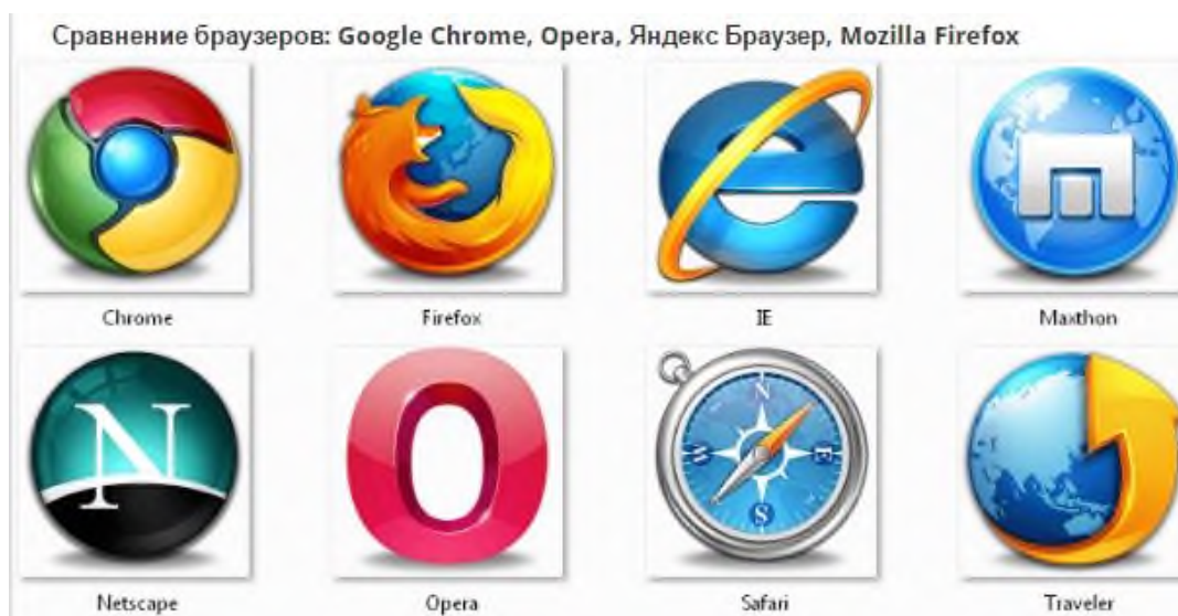
Рисунок 3 – Иконки популярных браузеров

Перемещение пользователей в интернете осуществляется при помощи специальных программ-браузеров. Их количество сейчас исчисляется десятками (см. рисунок 3). Но далеко не каждый браузер способен гарантировать приемлемую скорость, удобство и безопасность работы.