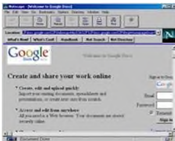
Рисунок 2 – Браузер Navigator

Компания Microsoft не могла не заметить такой успех Netscape Navigator и разработала свой собственный браузер в 1995 году, так же сделанный на основе NCSA Mosaic, и назывался он - Internet Explorer. Вследствие именно Internet Explorer (IE) стал неотъемлемой частью всех операционных систем этой компании. Так, как ОС Windows пользовалось огромное количество пользователей, IE быстро завоевал данную нишу и завоевал около 95% всего рынка. Это и привело к закрытию проекта Netscape Navigator, ведь конкурировать с такой монополией было невозможно.