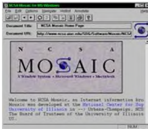
Рисунок 1 – Браузер Mosaic

году, он имел ошеломительный успех и приносил неплохую прибыль компании его разработчика (см. рисунок 2).